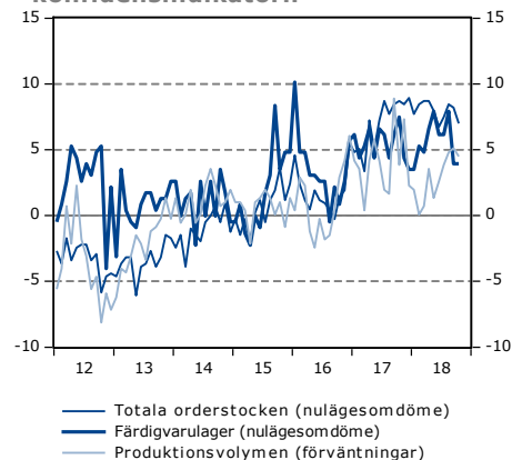
Diagram 3 Frågornas bidrag till konfidensindikatorn

Källor: Konjunkturinstitutet samt Swedbank och Silf